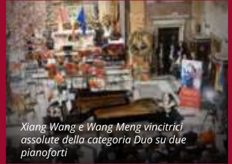
Xiang Wang e Wang Meng vincitrici assolute della categoria Duo su due pianoforti