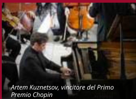
Artem Kuznetsov, vincitore del Primo Premio Chopin