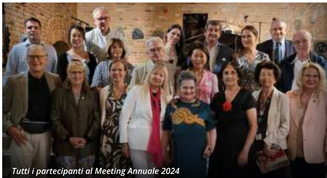
Tutti i partecipanti al Meeting Annuale 2024

Incontri internazionali, progetti importanti ed inoltre il 9 settembre scorso un concerto del M o Crudeli per