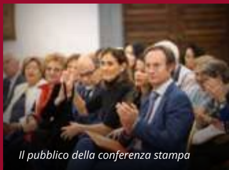
Il pubblico della conferenza stampa