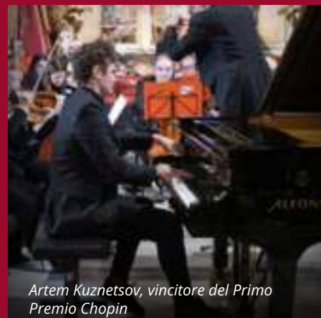
Artem Kuznetsov, vincitore del Primo Premio Chopin