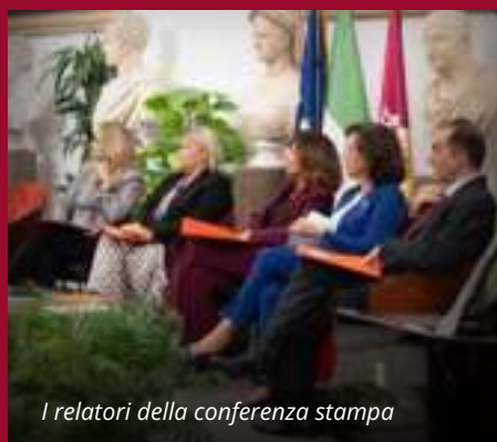
I relatori della conferenza stampa