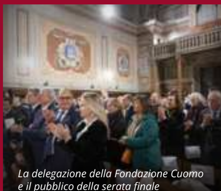
La delegazione della Fondazione Cuomo e il pubblico della serata finale