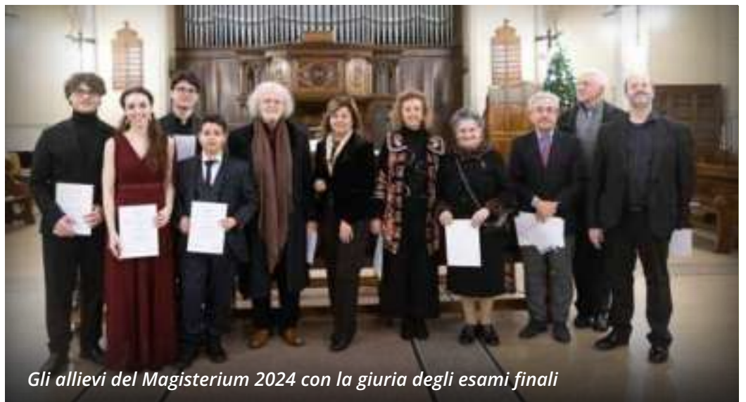
Gli allievi del Magisterium 2024 con la giuria degli esami finali