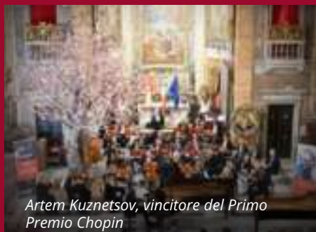
Artem Kuznetsov, vincitore del Primo Premio Chopin